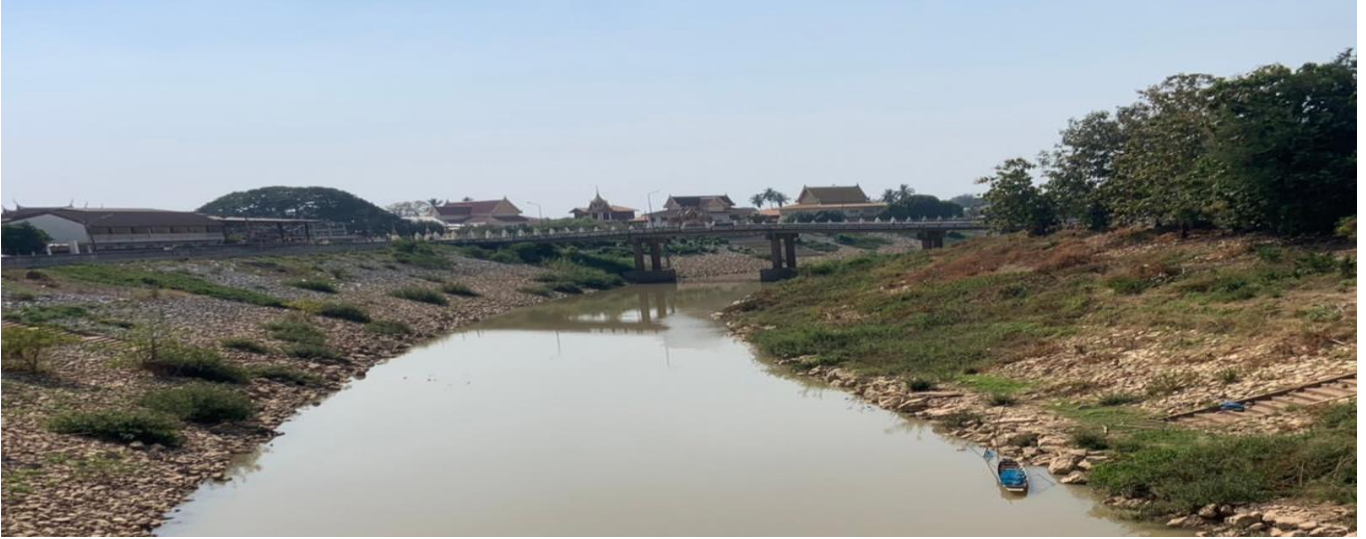
รูปตัดขวางลำน้ำ ปีน้ำ 2567 สถานี Y.33 แม่น้ำยม อ.ศรีสำโรง จ.สุโขทัย